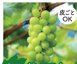
シャインマスカット